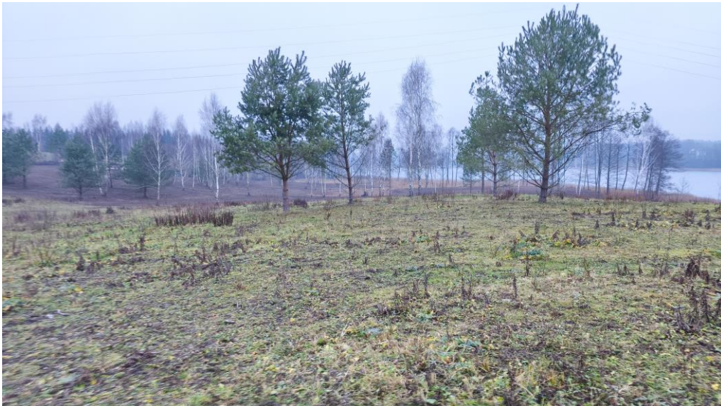
Fot.1. Tereny ekstensywnych pastwisk z naturalną sukcesją roślinności drzewiastej: sosna pospolita, brzoza brodawkowata

Na aktualną strukturę użytkowania omawianego obszaru składa się teren gruntów rolnych użytkowanych w formie ekstensywnych pastwisk, łąk. Warstwę zielną omawianego terenu stanowią pospolite gatunki traw, bylin i chwastów. Zieleń wysoką reprezentują pojedynczo rosnące gatunki drzew: sosna pospolita, brzoza brodawkowata (samosiejki).