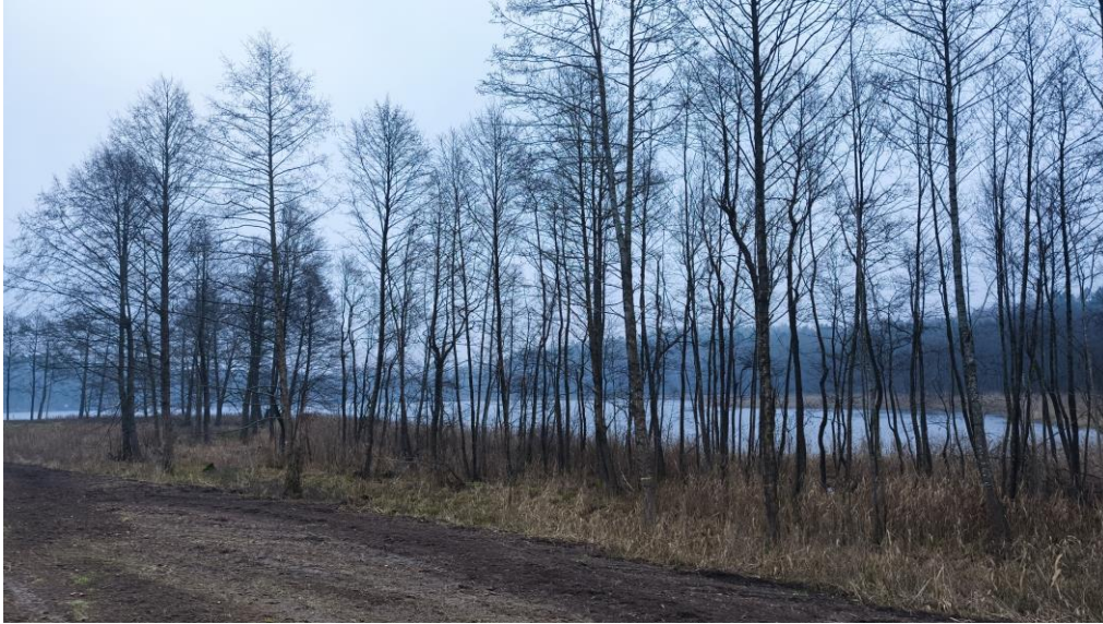
Fot.6. Pas roślinności szuwarowej, turzycowiskowej, oraz zbiorowiska olsu

Ukształtowanie terenu stanowi pozostałość po zlodowaceniu bałtyckim z przekształconą formą akumulacji lodowcowej i wodnolodowcowej z występującymi wysoczyznami falistymi. Charakteryzuje się zróżnicowanym ukształtowaniem powierzchni – teren pagórkowaty. Teren o prostych warunkach gruntowo-wodnych, przydatnych pod zabudowę. Wyjątek stanowi teren użytku zielonego i zbiorowiska olsu o złożonych warunkach gruntowo-wodnych, wskazany na załączniku graficznym do niniejszego opracowania. Kategorię geotechniczną całego obiektu budowlanego należy potwierdzić na podstawie badań geotechnicznych z właściwym określeniem warunków gruntowych zgodnie z rozporządzeniem Ministra Transportu, Budownictwa i Gospodarki Morskiej z dnia 25 kwietnia 2012r. w sprawie ustalania geotechnicznych warunków posadawiania obiektów budowlanych (Dz. U. z 2012r. poz. 463).