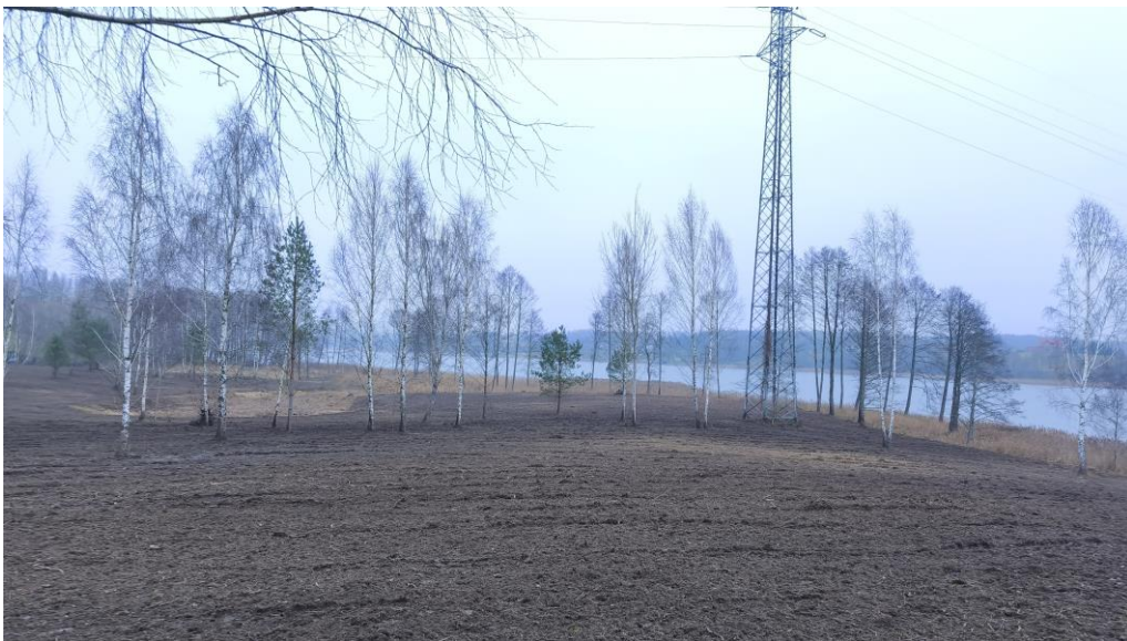
Fot.5. Sieć elektroenergetyczna WN 110kV

Przez analizowany obszar przebiega sieć elektroenergetyczna WN 110kV.