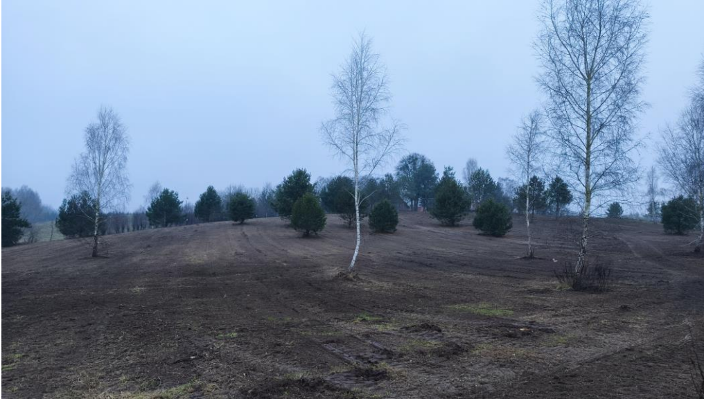
Fot.2. Tereny z naturalną sukcesją roślinności drzewiastej: sosna pospolita, brzoza brodawkowata

Pośród występujących pastwisk występują tereny obecnie nieużytkowane rolniczo z postępującą naturalną sukcesją nawłoci pospolitej.