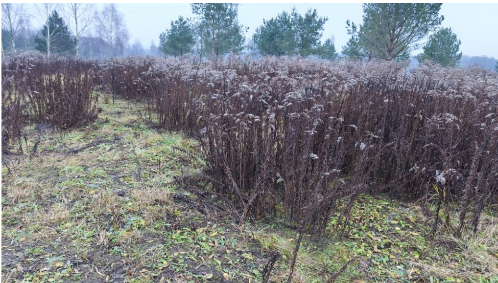
Fot.3. Nawłoc pospolita na terenach nieużytkowanych rolniczo

Pośród występujących pastwisk występują tereny obecnie nieużytkowane rolniczo z postępującą naturalną sukcesją nawłoci pospolitej.